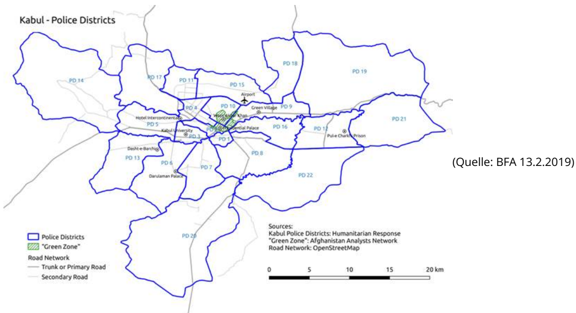
Abb.1: Kabul, Police Distrikts (Darstellung der Staatendokumentation)

Kabul-Stadt ist die Hauptstadt Afghanistans und auch ein Distrikt in der Provinz Kabul. Es ist die bevölkerungsreichste Stadt Afghanistans, mit einer geschätzten Einwohnerzahl von 5.029.850 Personen für den Zeitraum 2019-20 (CSO 2019). Die Bevölkerungszahl ist jedoch umstritten. Einige Quellen behaupten, dass sie fast 6 Millionen beträgt (AAN 19.3.2019). Laut einem Bericht, expandierte die Stadt, die vor 2001 zwölf Stadtteile – auch Police Distrikts (USIP 4.2017), PDs oder Nahia genannt (AAN 19.3.2019) – zählte, aufgrund ihres signifikanten demographischen Wachstums und ihrer horizontalen Expansion auf 22 PDs (USIP 4.2017). Die afghanische zentrale Statistikorganisation (Central Statistics Organization, CSO) schätzt die Bevölkerung der Provinz Kabul für den Zeitraum 2019-20 auf 5.029.850 Personen (CSO 2019). Sie besteht aus Paschtunen, Tadschiken, Hazara, Usbeken, Turkmenen, Belutschen, Sikhs und Hindus (PAJ o.D.; vgl. NPS o.D.).